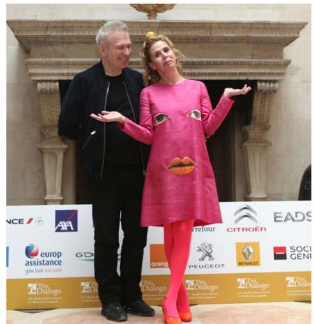
Agatha Ruiz de la Prada y Jean-Paul Gaultier en la Residencia de Francia (X Prix Diálogo, 2013)