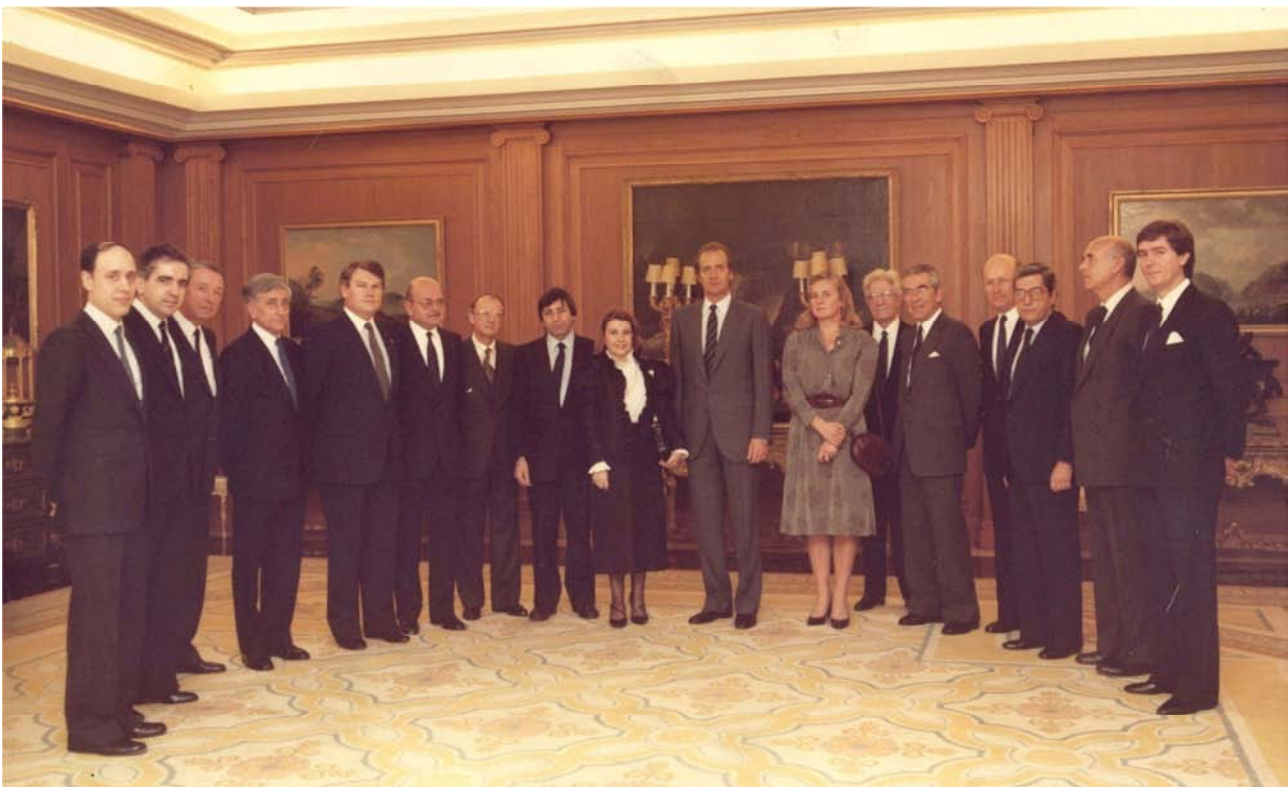
Audiencia de S.M. el Rey de España a la Junta Directiva de Diálogo (1983)

T.+34 91 559 72 77 / www.dialogo.es / eventos@dialogo.es