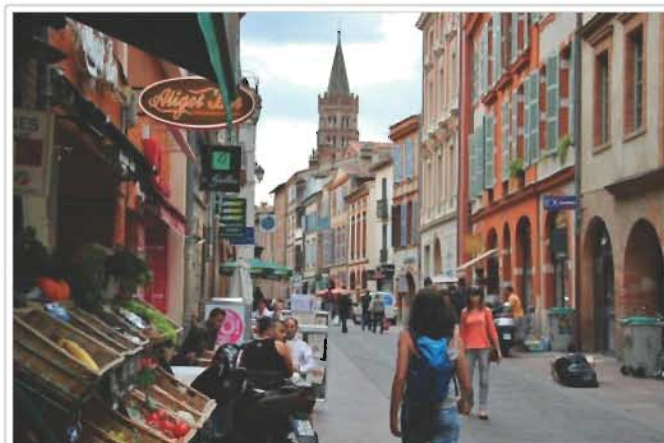
CONCURSO DE UN VIAJE A TOULOUSE EN LA SEMANA GASTRONOMÍA FRANCESA EN MADRID

En concreto, en esta ruta culinaria participan los restaurantes Beaucoup , Bonjour Madrid , El Picatoste , Gala , La Esquina del Real , Lafayette , La Maison d'Eva , Le comptoir de la crepe , Le Petit Bistro y Le Petit Prince .