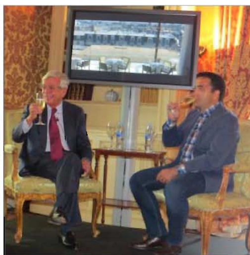
Velasco y Ansón brindaron con champagne francés

"La cultura nos acerca, la gastronomía nos une"