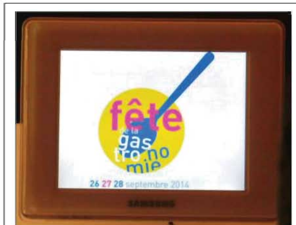
La Primera Edición de la Fête de la Gastronomie se celebrará en Madrid del 26 de septiembre al 5 de octubre de 2014

Componente esencial de la cultura francesa y fuente de permanente riqueza y creatividad, la Gastronomía francesa posiciona al país como referente de vanguardia internacional a nivel gastronómico.