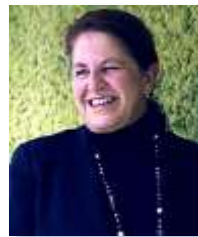
CECILIA BONED Presidenta del Grupo BNP Paribas en España