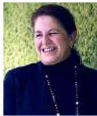
CECILIA BONED Presidenta del Grupo BNP Paribas en España