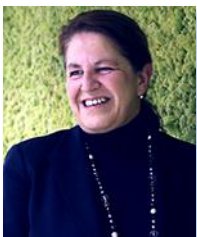
CECILIA BONED LLOVERAS Presidenta del Grupo BNP Paribas en España