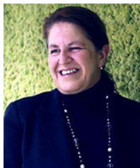
CECILIA BONED LLOVERAS Presidenta del Grupo BNP Paribas en España